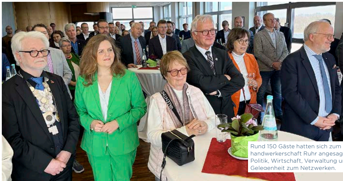
Rund 150 Gäste hatten sich zum Jahresempfang der Kreishandwerkerschaft Ruhr angesagt. Vertreter aus Handwerk, Politik, Wirtschaft, Verwaltung und Bildung nutzten die Gelegenheit zum Netzwerken.