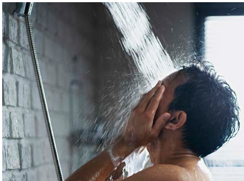
Duschen kann zur Arbeitszeit gehören und muss dann vergütet werden.

Die vergütungspflichtigen Zeiten für Umkleiden, Körperreinigung und Wege zwischen der Umkleidekabine zum Arbeitsplatz und